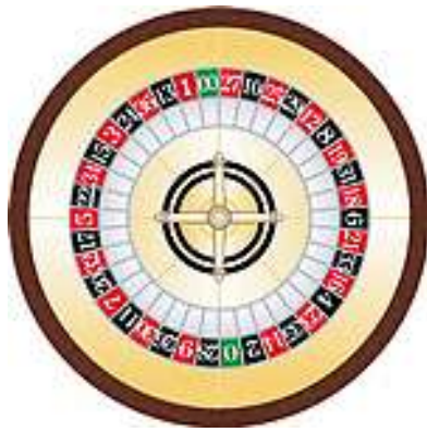
アメリカン・タイプ (38 数字)