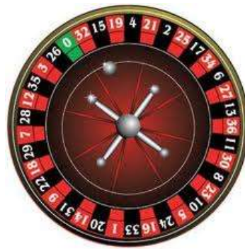
ヨーロピアン・タイプ (37 数字)